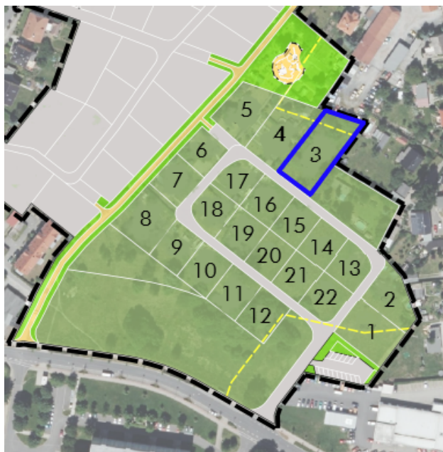
Übersicht des Baugebietes