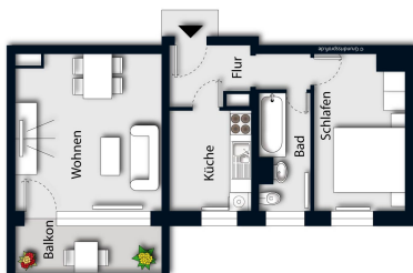
Grundrissbeispiel (Einrichtung nicht Vertragsbestandteil)